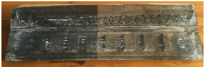
tavola lignea policroma pulitura laser Nd:Yag