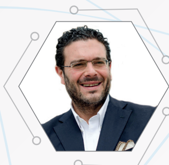
ERNESTO CARBONE Parlamentare della Repubblica