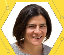
FRANCESCA DEL BELLO Presidente Il Municipio di Roma