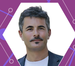
PAOLO GENOVESE Regista