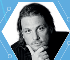
PAOLO BARBERIS Consigliere per l'Innovazione del Presidente del Consiglio dei Ministri