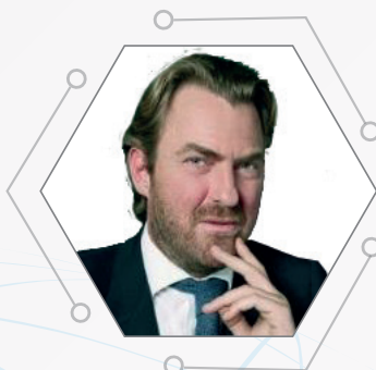
BERNABÒ BOCCA Senatore della Repubblica e imprenditore