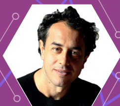
MATTEO GARRONE Regista