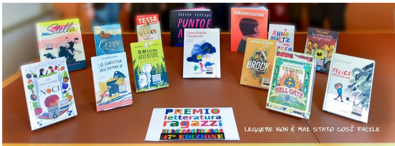
Figura 1: Libri finalisti 47° edizione