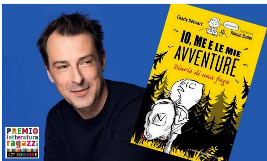
Figura 3: Gek Tessaro

6 maggio : al Teatro Pandurera per i bambini delle scuole primarie sarà in scena Il Teatro disegnato dal vivo: Gek TESSARO presenta PINOCCHIO ( didattica@comunicamente.it ); nella sede della Fondazione ore 11 Katia FORNAROLI presenta il “Laboratorio PENNE DI LATTA, introduttivo alla Calligrafia”, per i ragazzi delle scuole secondarie di I grado; sempre alle 11.00 presso la Pinacoteca San Lorenzo, inaugurazione della Mostra degli Illustratori selezionati al XXII Concorso per Illustratori del PLR .