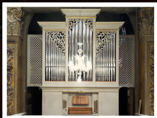
Grand'Organo "F. Zanin" Collegiata Pieve di Cento (BO)

Organo: nuova sezione aperta a Marche, Emilia-Romagna, Veneto, Friuli e Lombardia