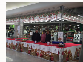
Banchetto per il confezionamento dei regali