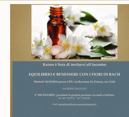
Serata della rassegna Benessere. I Fiori di Bach