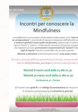
Serata della rassegna "Benessere", la Mindfulness

Uno dei nostri principali obiettivi è creare un interfaccia con le Istituzioni e con tutte le principali realtà impegnate in prima linea nella lotta ai DCA.