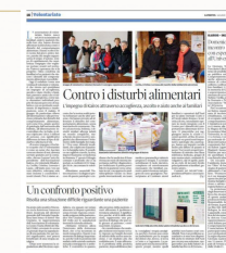
Divulgazione delle nostre iniziative sulla stampa locale