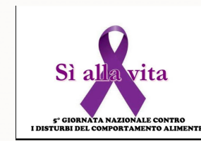
In prima linea con le istituzioni nella lotta contro i DCA