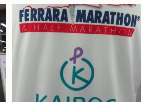
Partecipazione a Ferrara Marathon