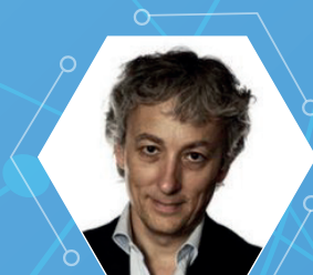
RICCARDO LUNA Direttore CheFuturo! e Digital Champion per il Governo Italiano